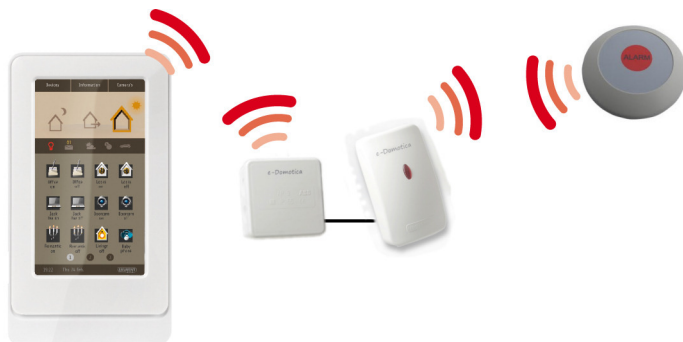
Afbeelding 1. Draadloze verbindingen

Het systeem werkt draadloos, de tafelknop staat draadloos in verbinding met de alarmontvanger van de EM6640 e-Domotica Noodoproep Knop (vereist). Deze ontvanger is wederom draadloos gekoppeld met uw e-Domotica e-Centre basisstation via de EM6515 e-Domotica Interface Link. Uw e-Domotica e-Centre kan draadloos of bekabeld verbonden zijn met het internet. Via de streng beveiligde verbinding met de online e-Domotica Portal wordt vervolgens het alarm via telefoon, SMS of e-mail doorgestuurd naar één of meerdere contactpersonen.