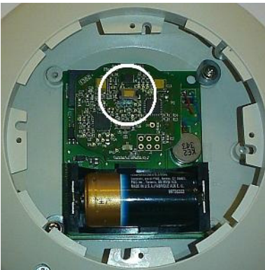
Afbeelding 3. Binnenkant van de tafelalarm knop