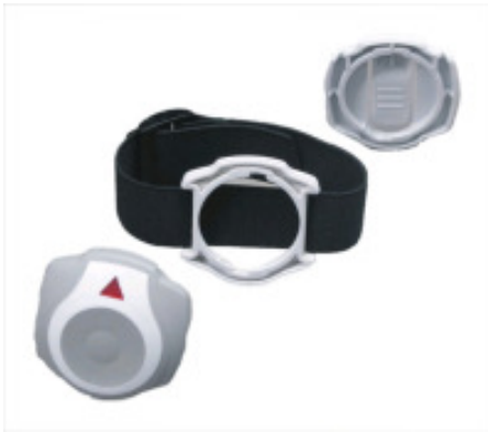
Afbeelding 4 – Noodoproep knop met polsband

Haal de achterkant van de noodoproep knop los en gebruik de polsband om de noodoproep knop aan de pols te gebruiken. De polsband is instelbaar dankzij de flexibele band.