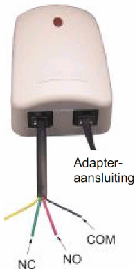
Afbeelding 1 – Aansluitingen alarmontvanger