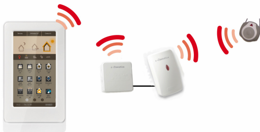
Afbeelding 1. Draadloze verbindingen

alarm kunt u direct op de knop drukken en via uw e-Domotica e-Centre basisstation familie, naasten of een mantelzorger automatisch oproepen.