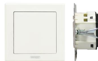
Afbeelding 3: Productfoto