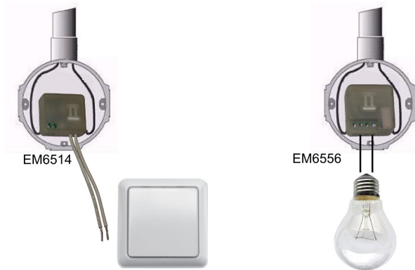
Figura 1, Sensor para interruptor de pared Mini interruptor

En la siguiente figura puede ver una de las situaciones más típicas para utilizar un mini interruptor EM6556 junto con el sensor para interruptor de pared EM6514. Mediante el sensor para interruptor de pared EM6514 (no incluido; se vende por separado) podrá utilizar un interruptor de pared existente para activar un ambiente a su gusto.