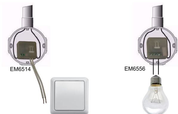
Abbildung 1, Wandschaltersensor EM6514 Minischalter EM6556

In der folgenden Abbildung sehen Sie eine der häufigsten Situationen, in denen Sie den Minischalter EM6556 in Kombination mit dem Wandschaltersensor EM6514 einsetzen können. Durch den Einsatz des Wandschaltersensors EM6514 (separat erhältlich, nicht mitgeliefert) können Sie den vorhandenen Wandschalter auch zum Steuern eines eigenen e-Domotica-Szenarios einsetzen.