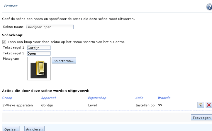
Afbeelding 5. Een scène waarijn de gordijnen geopend worden