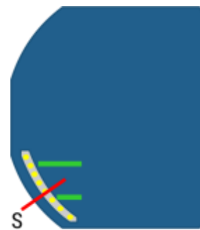
Afbeelding 3: Knop